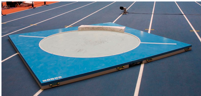
Plate-forme portable pour le lancer de poids en salle en bois multicouche à haute résistance sur une structure métallique rendant l'élément plus rigide et plus robuste.

Elle est formée de deux parties dotées de poignées pour en faciliter le transport et le stockage.