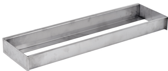
Planche d'appel en acier inox (AT010)

Conçue, produite et certifiée conformément aux règlements de la Fédération Internationale (Certificat IAAF E-99-0181).